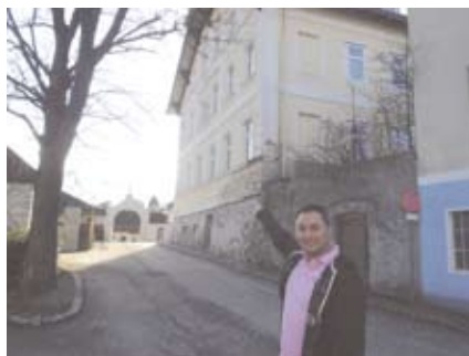
Bild: Das Gebäude des neuen Ärztezentrum in der Bachgasse, das durch Trockenlegung und Renovierung zu einem modernen Praxisgebäude werden wird.

Das bestehende Gebäude (siehe Bild) wird trocken gelegt, kernsaniert und wird modernste Praxen beheimaten.