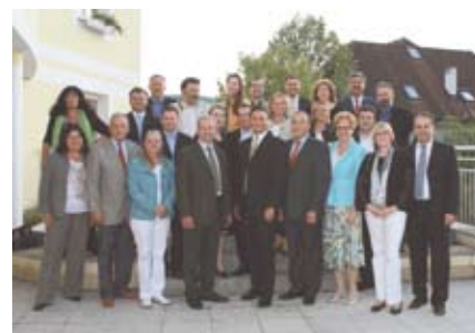
Bild: Gesamter Gemeinderat.

Dies hat im Dezember 2010 in einer eigenen Arbeitsgruppe aller Fraktionen stattgefunden und es wurden für 2010 Projekte gewählt, die aus diesem Topf finanziert werden.