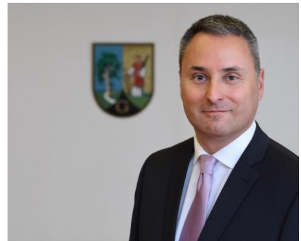
Gablitz, im Dezember 2019